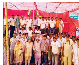
कैथल। पूर्व सैनिकों का स्वागत करते ग्रामीण

पूर्व सैनिक वेलफेयर एसोसिएशन जिला कैथल ने जिला परिषद कैथल नगर परिषद कैथल नगर पालिका राजौंद के सहयोग से 22 व 23 जून को 58 साल बाद सर्वोच्च बलिदानियों के परिवारों को फिर से याद दिला कर उनको जिंदा किया। उनके गांव में एक अनोखी पहचान बनाई गांव में सर्वोच्च बलिदानियों के परिवारों को मान सम्मान दिलावाया। ये कार्यक्रम 22 जून को कारगिल विजय सिल्वर जुबली तिरंगा रथ यात्रा का जैसे ही जिला कैथल के अंदर प्रवेश 152 डी राजौंद असंध मार्ग से हुआ। वहीं से इस कारगिल विजय सिल्वर जुबली तिरंगा रथ यात्रा का भव्य स्वागत शुरू हुआ। इनके साथ मिलकर सबसे पहले