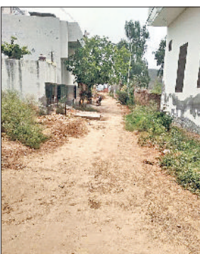
कलायत में आवासीय कालोनी की बदहाल गलियाँ।