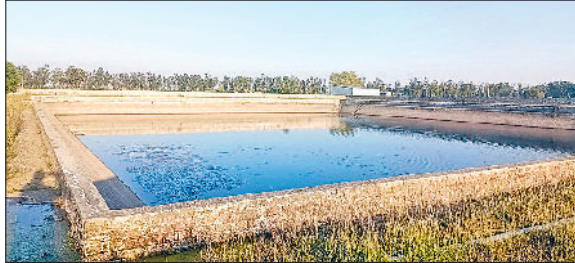
राजौंद। राजौंद में सूखे हुए जलधर के टैंक।

गर्मी के इस मौसम में पानी के गंभीर संकट से जूझने को मजबूर हो रहे कस्बा राजौंद के लोग