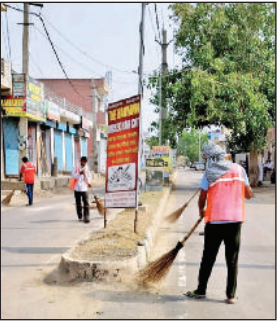
उचाना। नया एरिया में चल रहा मेगा सफाई अभियान।

लगभग चोथे दिन नया एरिया, शहर के बाजारों में मेगा सफाई अभियान के तहत सफाई हो रही है। बाजारों में धूल न उड़े इसके लेकर पानी का छिड़काव भी करवाया जा रहा है। 60 के करीब कर्मचारी, 4 ट्रैक्टर-ट्राली के साथ मेगा सफाई अभियान चलाया जा रहा है। दुकानदारों, राहगीरों को स्वच्छता का संदेश देने के साथ-साथ दुकानदारों को दुकानों पर डस्टबीन रखने के भी प्रेरित कर