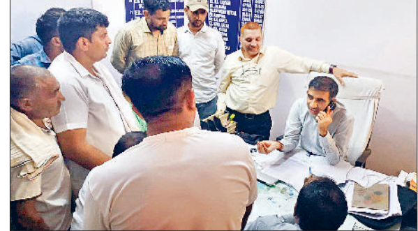
बिजली निगम कार्यालय में पहुंचे लजवाना कलां के ग्रामीण।

ग्रामीणों ने बताया कि चुनाव से पहले सोलर प्लांट लगाने वाली एक कंपनी ने पाडला गांव में सर्वे किया था जिन्होंने शुरूआत में 240 एकड़ जमीन अधिग्रहण करने की बात कही थी। अब 300 एकड़ में प्लांट