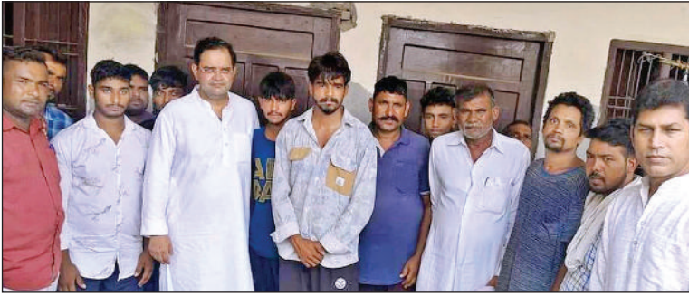
उचाना। कार्यकर्ताओं के साथ पूर्व सांसद एवं कांग्रेस नेता बुजेंद्र सिंह।

पत्रकार वार्ता में बार-बार हिसार एयरपोर्ट के हो रहे उद्घाटन पर बोलते हुए बुजेंद्र सिंह ने कहा कि पहले भी कह चुका हूँ कि ये एयरपोर्ट है बस अड्डा नहीं है। जहां चार दीवारी बना कर बसों के खड़ा होने के लिए जगह बन गई फिर बसें आई