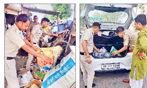
जींद। जांच करते हुए टीम सदस्य।